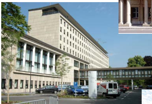
Adenauerallee 99 – 103, Bonn