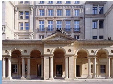
Mohrenstraße 37, Berlin