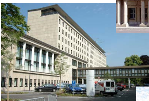
Adenauerallee 99 – 103, Bonn