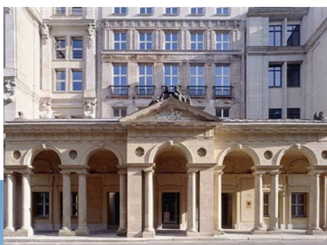
Mohrenstraße 37, Berlin