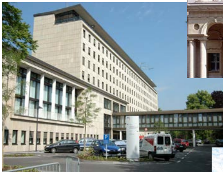
Adenauerallee 99 – 103, Bonn