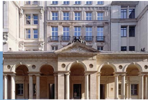
Mohrenstraße 37, Berlin